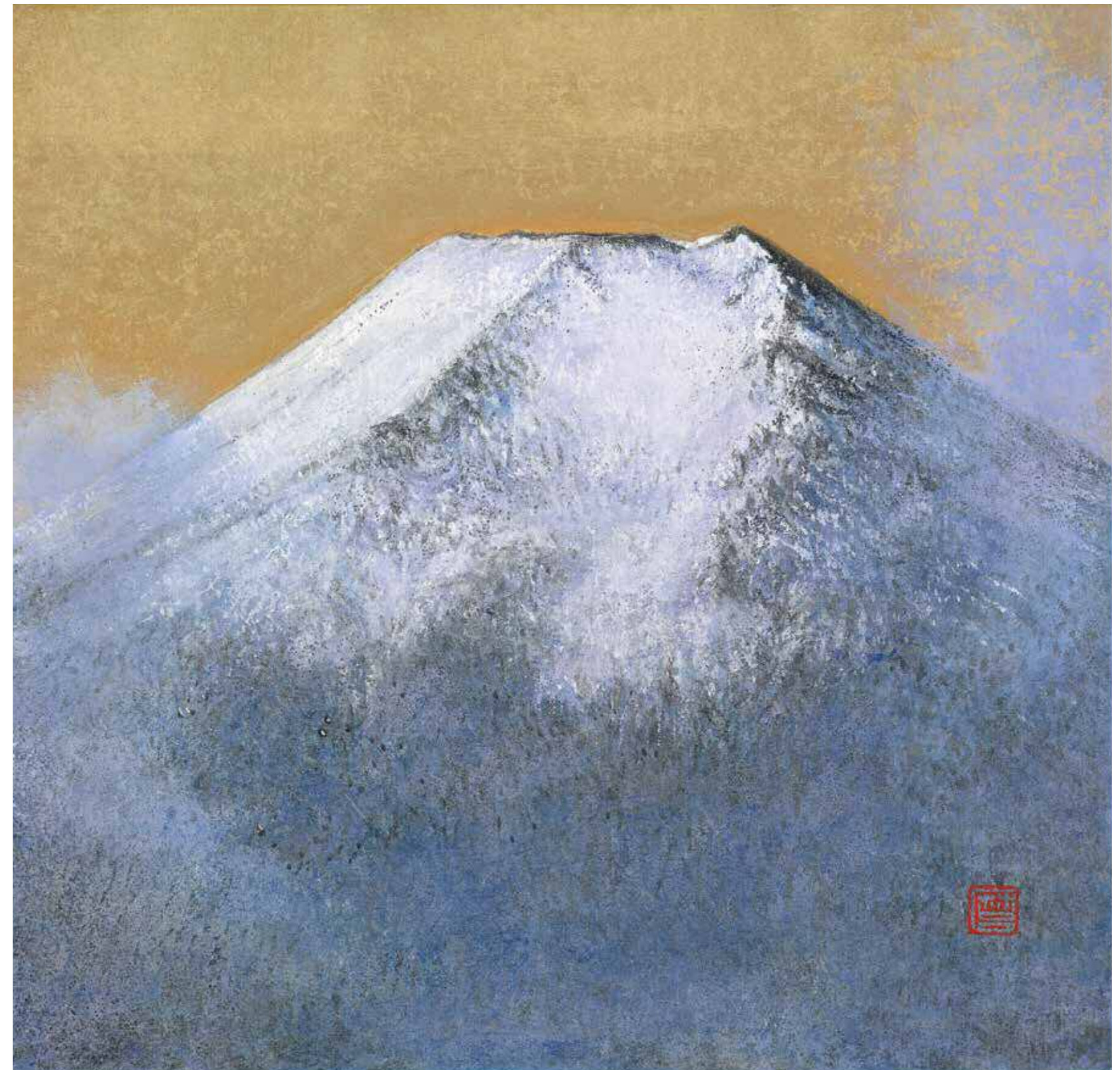
「白嶺」 川瀬 磨士(再興第102回院展 全作品集の表紙絵)

※ちゅーピーくらぶ会員証のご提示により2名様まで200円の割引。※障害者手帳をご提示の方は、ご本人と同伴者1名様が無料。