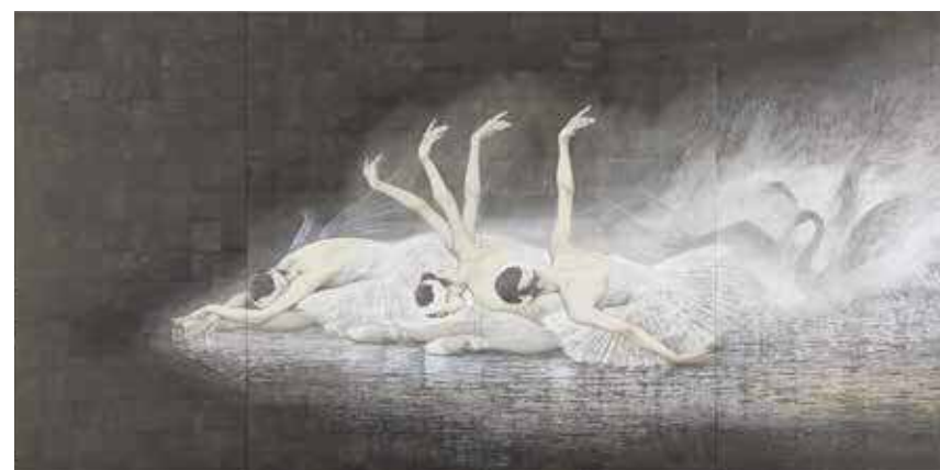
「瀕死の白鳥」 西田 俊英